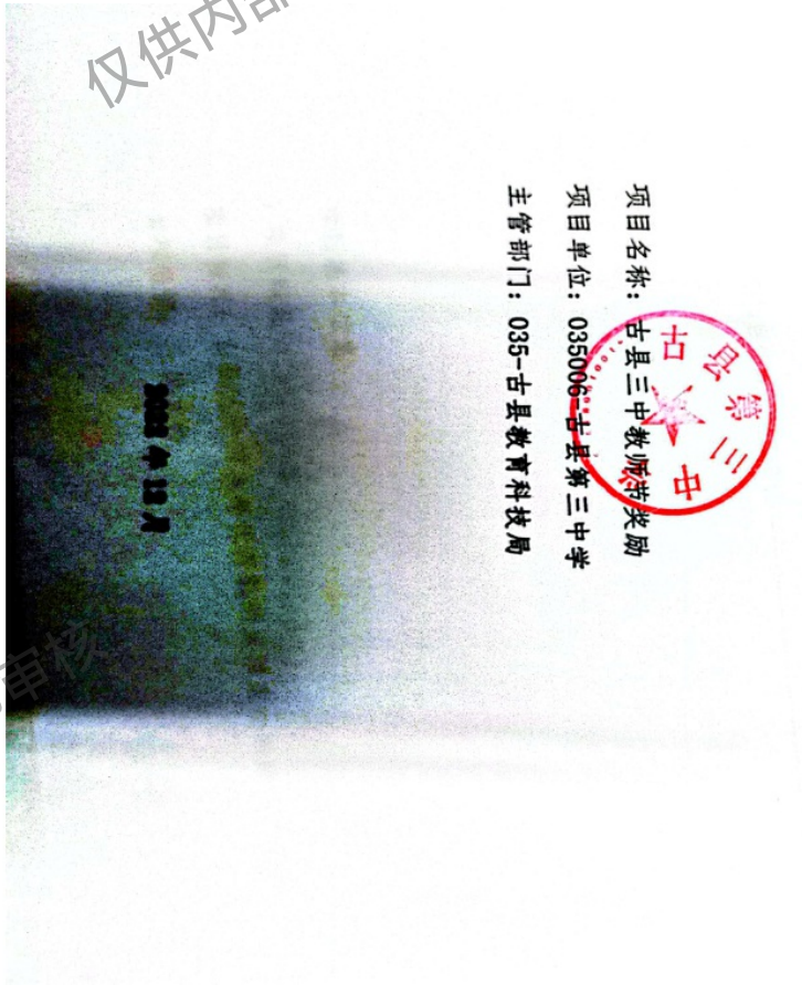
项目支出绩效自评分析报告